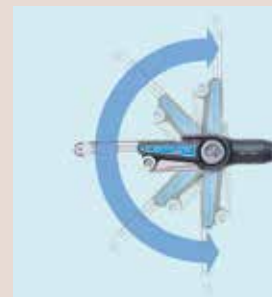
ベルト角度が自由に調整できます。