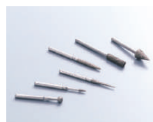
電着ダイヤモンド